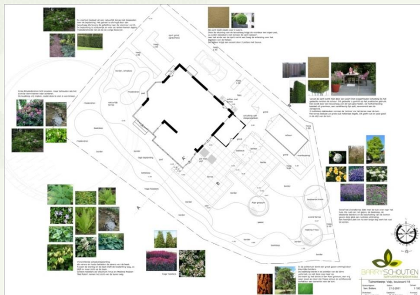
Uitleg definitief ontwerp